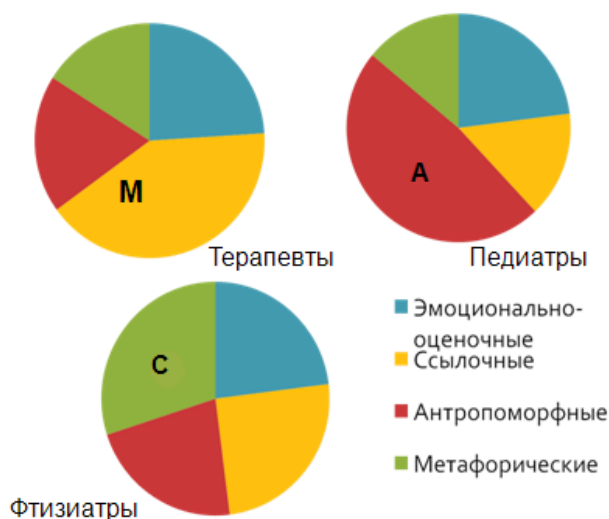
Рисунок 2. Частотное распределение типов описаний изображений стимулов по группам врачей.

Профессиографический анализ медицинских специальностей терапевтического (лечебного) профиля по блокам требований к врачам (ведение пациента, работа с медицинской документацией, контроль сестринского персонала) позволили выделить четыре типа описаний: эмоционально-оценочные, характеризующие отношение самого респондента к описываемому объекту, стоящему, по его мнению, за изображением (нравится, приятный, симпатичный и тому подобное.); ссылочные — прямые предметные квалификации (указание геометрических свойств изображений и конструктивных особенностей, ссылка на предмет по сходству формы, определения, точно указывающие на объект, ассоциирующийся с изображением и использование грамматической формы «-образное»); антропоморфные — приписывание изображению личностных свойств и человеческих качеств, социальные символы и стереотипы, ссылки на социальные явления и культурные объекты, нестандартные по форме или относящиеся к оценке выполнения стимульного материала исследователем (молодой, глупый, говорит тост, смеющийся и т.п.); метафорические — указание признаков, характерных для объектов, принадлежащих к иному классу, нежели само изображение, использование межмодальных метафор (пахнет, колючий, светящееся).